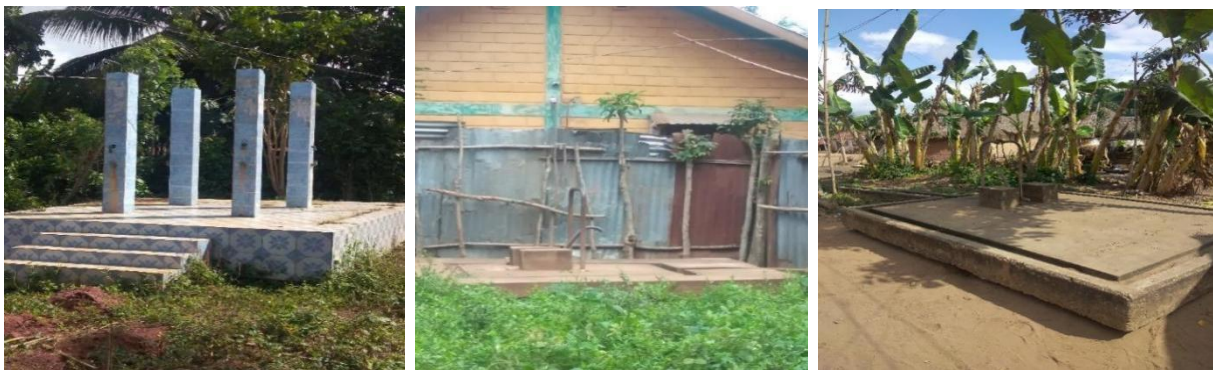
Planche 4 : Quelques sources d'approvisionnement en eau en panne dans la commune de Dangbo