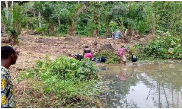
Planche 1: Rivière de d'Aïdégbè à Kessounou