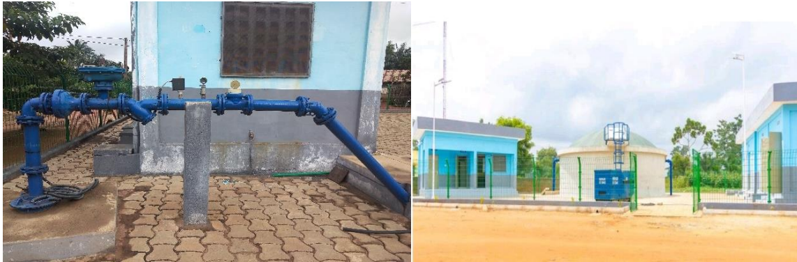
Planche 2: Système d'Approvisionnement en Eau Potable multi Villageois (SAEPmV) de Kessounou