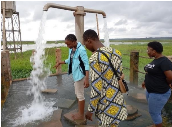
Planche 3: Source thermique de hêtin-sota